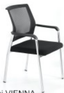
Stół z krzesłami VIENNA