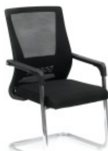
Stół z krzesłami MILANO