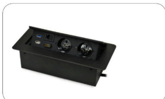
Mediaport 2x230V 2xUSB HDMI RJ45