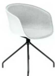
Stół z krzesłami OSLO