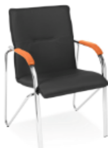
Stół z krzesłami SYDNEY