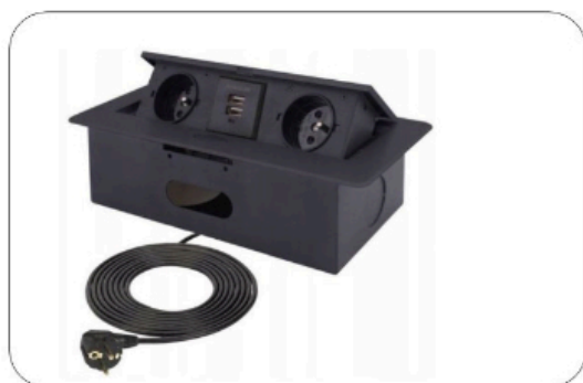
Mediaport 2x230V 2xUSB