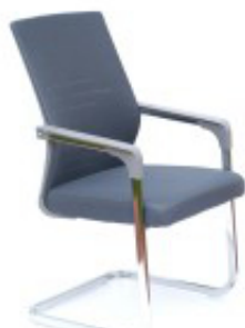
Stół z krzesłami BERLIN