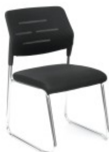
Stół z krzesłami HELSINKI